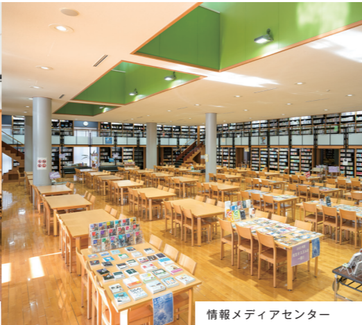
情報メディアセンター