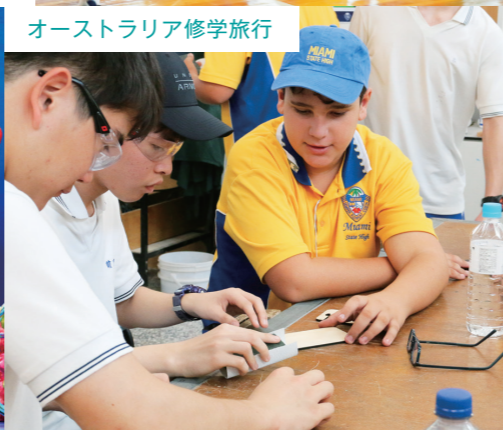
オーストラリア修学旅行