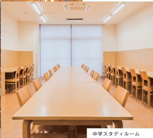
中学スタディールーム