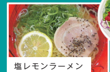
塩レモンラーメン