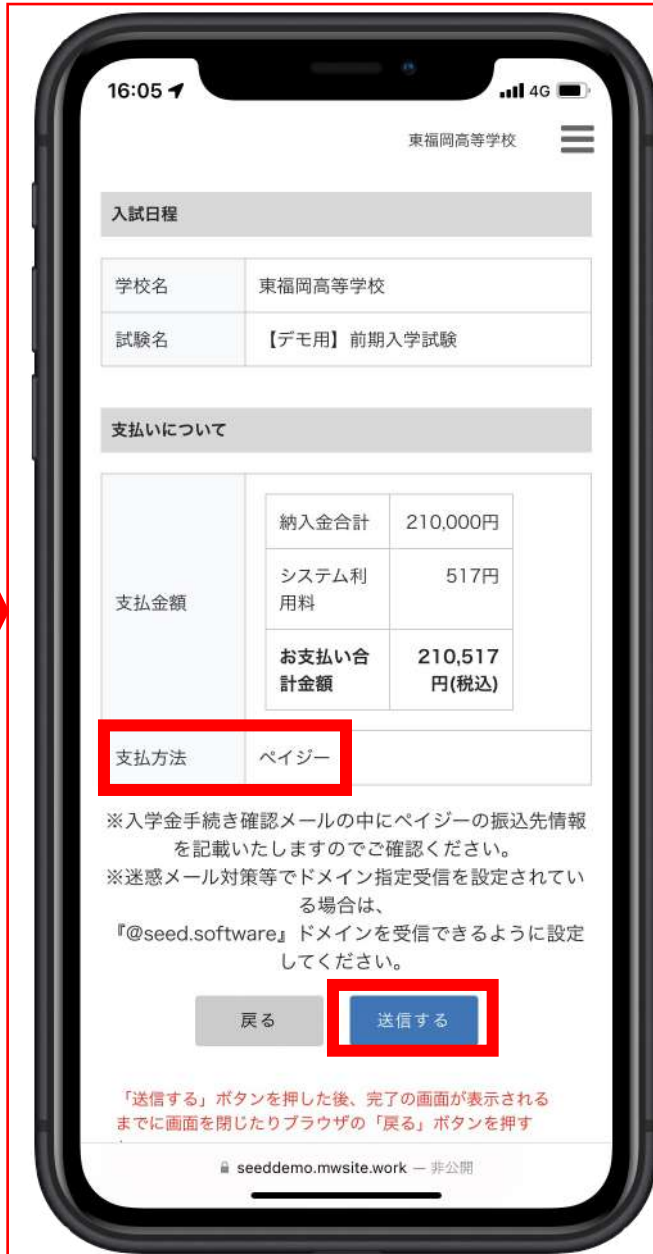
「ペイジー」の画面。「送信」をタップ。