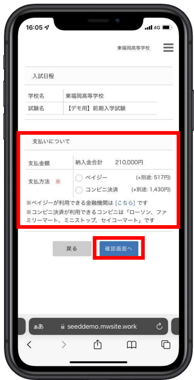
「ペイジー」か「コンビニ決済」を選択。