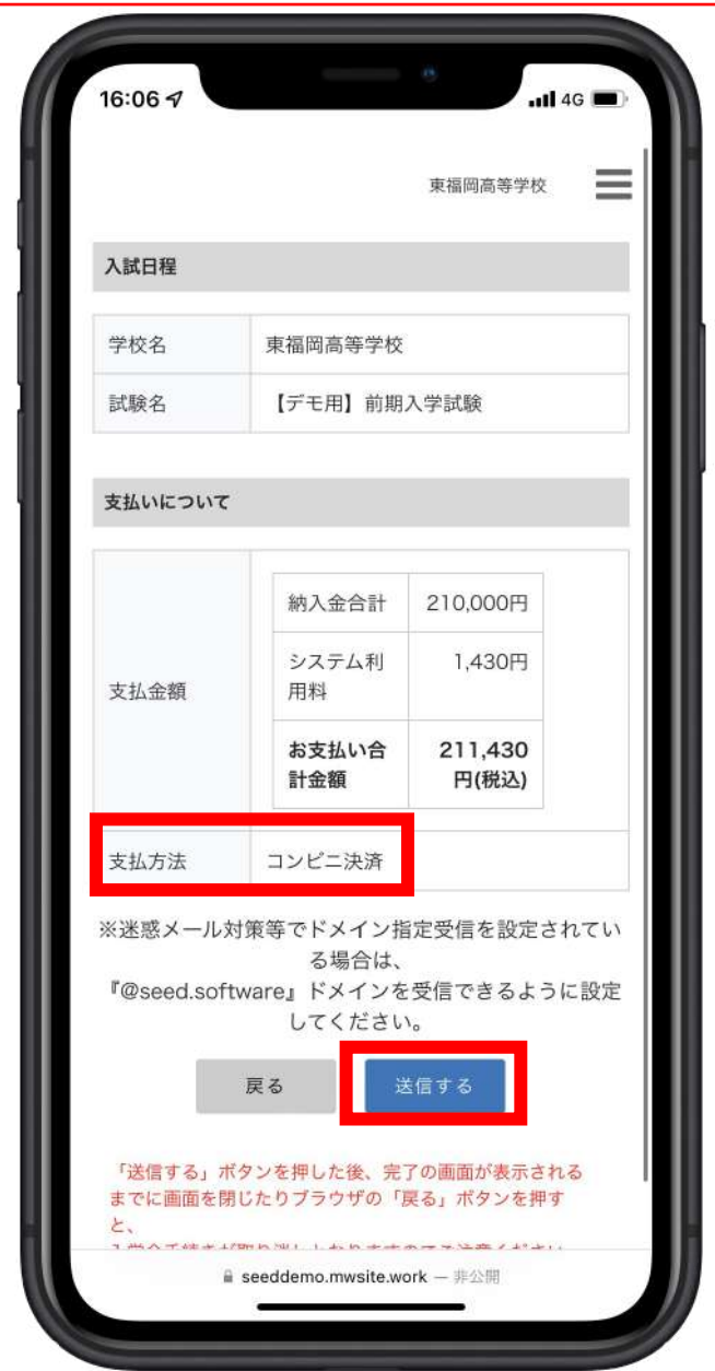
「コンビニ決済」の画面。「送信」をタップ。